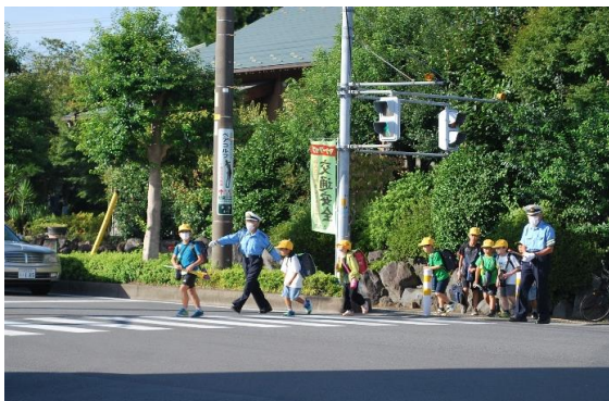
●交通誘導の様子(戸塚支所交差点)